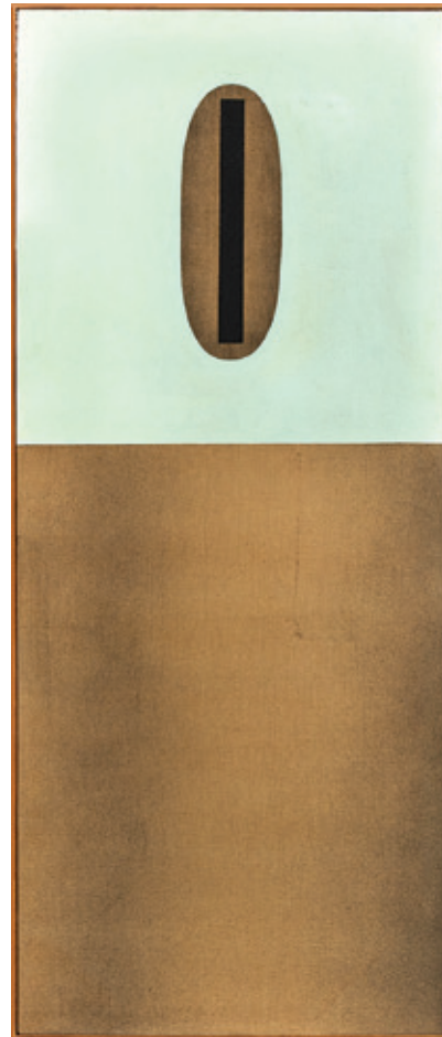
Сл. 4. Milet Andrejevic, Contact Unit , 1962, уље на платну, око 142 × 58 cm (56 × 22.75 in.).

Једна од парадигматских слика геометријске апстракције, United Desires (1962), излагана на групној изложби New Work Part I коју је Белами приредио у Галерији Грин 1963, управо је пример за еротске призвук и карналност које Андрејевић придаје употребним предметима као што су цилиндри сефова (STEIN 2017: 185). Белами је потенцирао уметничке радове са експлицитним или прикривеним еротским садржајем, 10